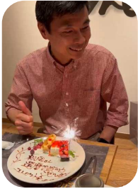
還暦の赤は赤ん坊が魔除けに赤をつけるのと同じ。

あと死ぬまでは勉強を欠かさない様にします。読書、講演会、勉強会などで興味があることを学びます。掃除など社会に役立つことも継続します。そして自然と、国宝である子供たちを、広い視野で大切にします。今後ともご指導ご鞭撻の程よろしくお願い致します。