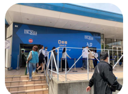
出展ブースも多く見るのも時間がかかります。