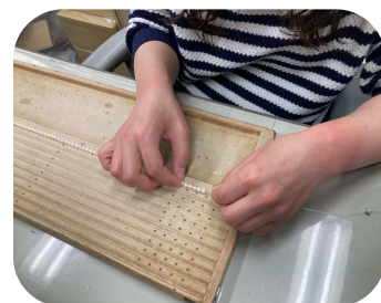
真珠の重さで糸は伸びます。