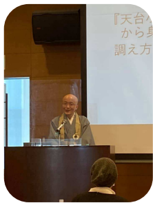
管長のブログも、 勉強になります。

座禅は専門的でハードルが高いですが、深呼吸を意識 することは普段の生活に活かすことができます。