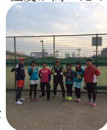
防寒ウェアが重要

無理のない気持ちの良い量、強度で練習していると、免疫力が上がっていると考えられます。過ぎたるは、及ばざるがごとしということですね。