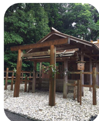
本来の内宮とも 言われる伊雑宮