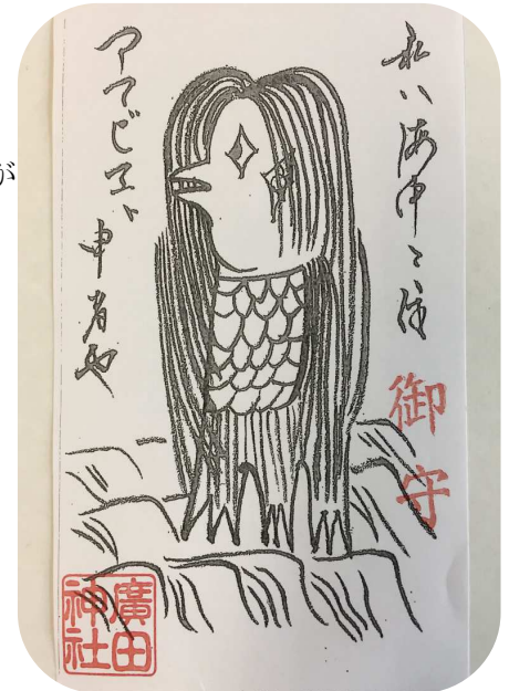
足が三本あります。