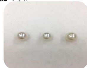
左が一番上級品です。