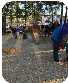
広田参道を美しくする会の境内清掃