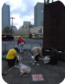
三宮掃除に学ぶ会の街頭清掃