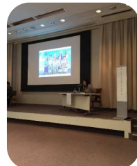
会場は芦屋大学で、盛会でした。