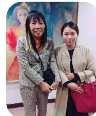
記念撮影にも、気さくにに応じてくださいました。