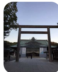
皇居ラン途中で靖国神社参拝