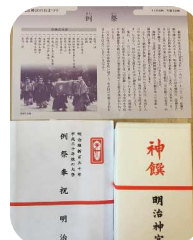
手拭、御神酒、干菓子です。