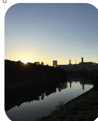
早朝は人が少ない皇居ラン

歩くと時間がかかってしまいますので、出張ジョギングをするとマラソンをやっていて本当に良かったなと思います。