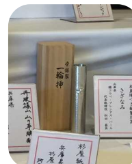
兵庫県コーナーに展示されました