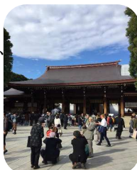
現在工事中で仮殿でした

物をつくる会社が減っている時代に、あらためて物づくりの仕事をしていて良かったと思いました。