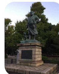
西郷どんにも、朝のご挨拶