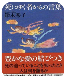
今を大切にしたいと思う本です。