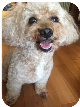
我家の愛犬ココちゃん 今年で10歳です。