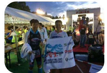
前回の皆生トライアスロンは、兵庫同友会で一緒している方と譲り合ってゴールでした。

趣味ではじめたスポーツですし、ある程度体力、技術もつき、やめるのは勿体無いので自分の現状を受け入れて、無理せずマイペースで楽しむのが良いかと思えます。